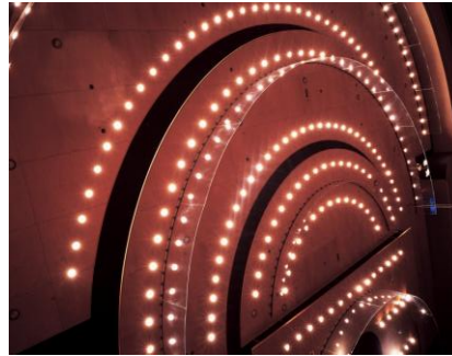
Sukulaisia konserttitalissa (kuva: ML) sekä oik. kelluvat kanoopit ( www.sibeliustalo.fi ).