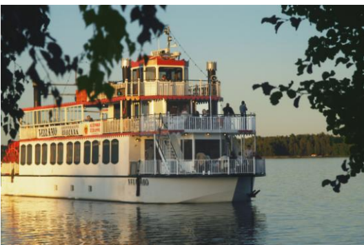
Vellamo Vesijärven aalloilla.

Risteily oli miellyttävä kokemus ja ihmiset viihtyivät laivalla.